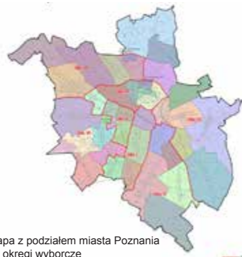
Mapa z podziałem miasta Poznania na okręgi wyborcze

Prezes Rady Ministrów rozporządzeniem z 20 sierpnia 2014 r. w sprawie zarządzenia wyborów do rad gmin, rad powiatów, sejmików województw i rad dzielnic m.st. Warszawy oraz wyborów wójtów, burmistrzów i prezydentów miast, zarządził na dzień 16 listopada 2014 r. przeprowadzenie wyborów samorządowych.