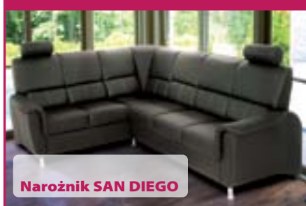
Narożnik SAN DIEGO

Narożnik prawo lub lewostronny. Funkcja spania, pojemnik na pościel, regulowane zagłówki oraz ruchome oparcia w części narożnej. Siedziska na podwójnej sprężynie falistej i bonelowej, bardzo wygodny do siedzenia. Wym. 220 x 270, Spanie 205 x 120