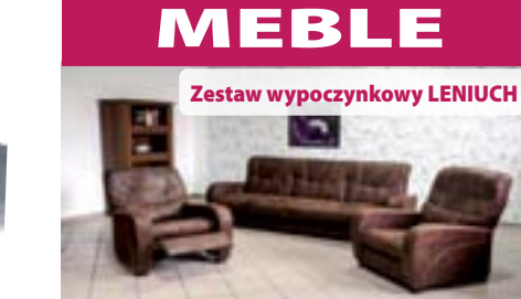
Zestaw wypoczynkowy LENIUCH

Zestaw Bora Pikowany: Kanapa posiada funkcję spania oraz pojemnik na pościel. wymiary; Kanapa dł. 220 cm. gł. 95 cm. wys. 90 cm. spanie 187/120 cm. fotel dł. 87 cm. gł. 82 cm. wys. 90 cm.