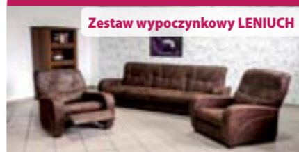
Zestaw wypoczynkowy LENIUCH