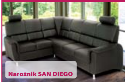
Narożnik SAN DIEGO

Narożnik prawo lub lewostronny. Funkcja spania, pojemnik na pościel, regulowane zagłówki oraz ruchome oparcia w części narożnej. Siedziska na podwójnej sprężynie falistej i bonelowej, bardzo wygodny do siedzenia. Wym. 220 x 270, Spanie 205 x 120