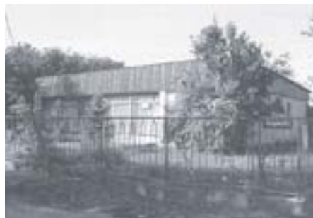
Pawilon filii Biblioteki Raczyńskich lata 90-te przy ul. Zakopiańskiej 36a

Agnieszka Juskowiak tel. 505 528 144 biuro@fachowcywmiescie.pl www.fachowcywmiescie.pl Poznań, ul. Dedala 5