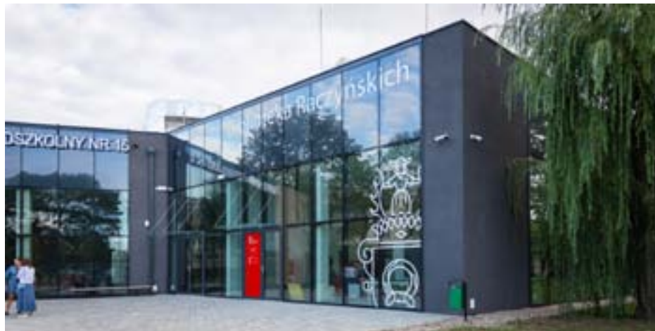
Pawilon filii Biblioteki Raczyńskich przy ul. Druskienickiej 32, rok 2022

W najbliższych dniach znajdziecie Państwo w swoich skrzynkach na listy kolejny numer Sprawozdania Rady Osiedla. Zachęcamy do lektury. Jedną z najważniejszych informacji jest informacja o otwarciu Filii nr 35 Biblioteki Raczyńskich, która zamiast w piwnicy szkolnej mieści się teraz w pięknym obiekcie na terenie Zespołu Szkolno-Przedszkolnego nr 15.